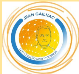
Logo do Ano Jean Gailhac

INSTITUTO DAS RELIGIOSAS DO SAGRADO CORAÇÃO DE MARIA – ÁREA BRASIL –