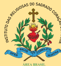
Logo da Área Brasil